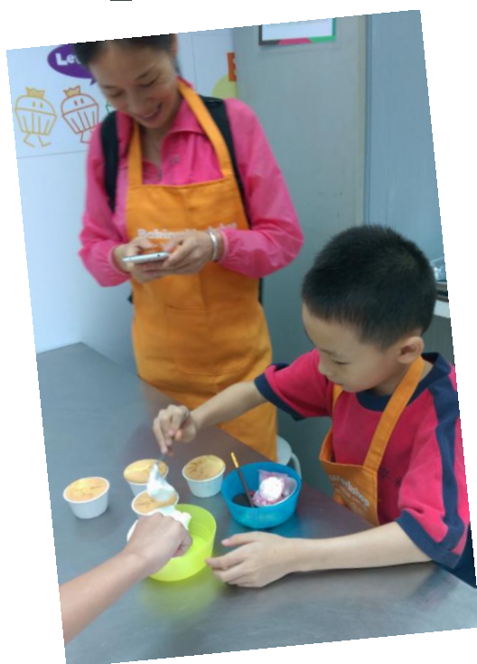
<親子給 Cupcake> -家長與子女共同製作健康美味的杯子蛋糕