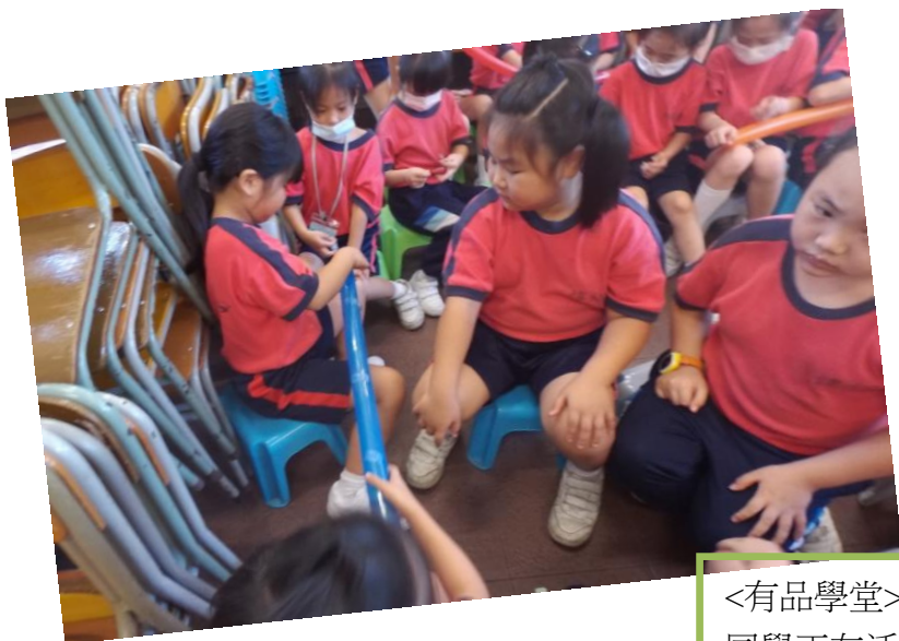
<有品學堂> - 同學正在活動中體驗不同性格 強項所帶來的喜悅