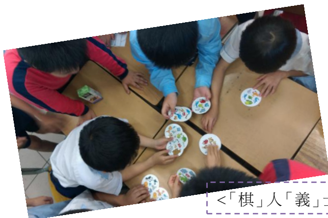
<「棋」人「義」士> - 與低年級同學玩 Double