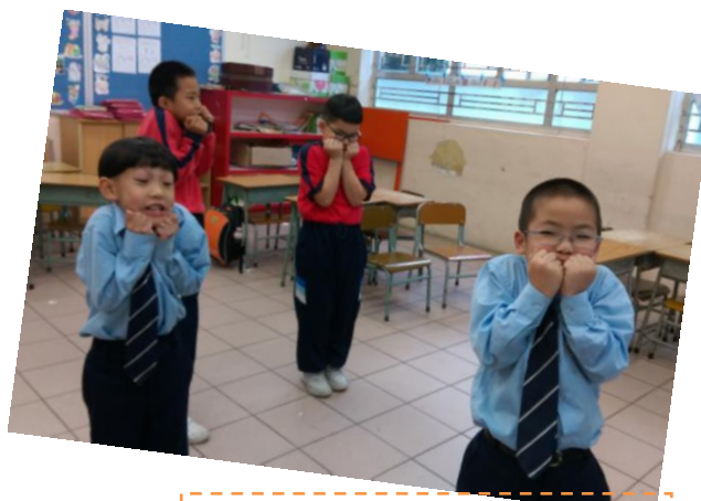
<情緒小主人> - 情緒紅綠燈