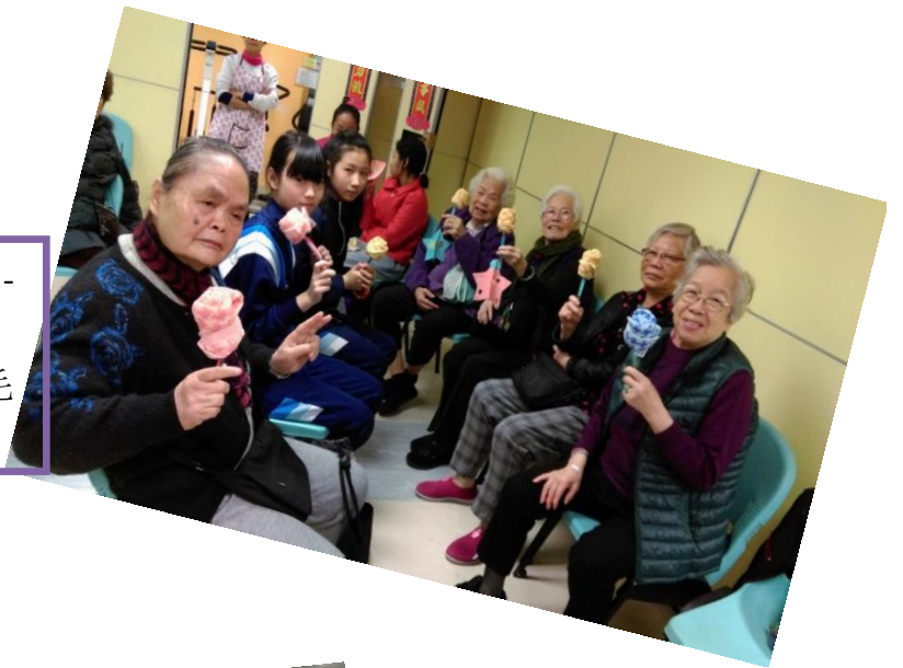
<耆 TEEN 共融聯校義工計劃> - 探訪老人中心，與長者做做手 工，用牙刷及毛巾做出漂亮的毛 巾花