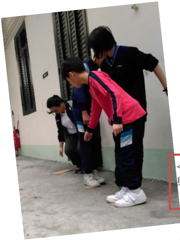
<耆 TEEN 共融聯校義工計劃> - 與大姐姐玩歷奇遊戲，建立關係