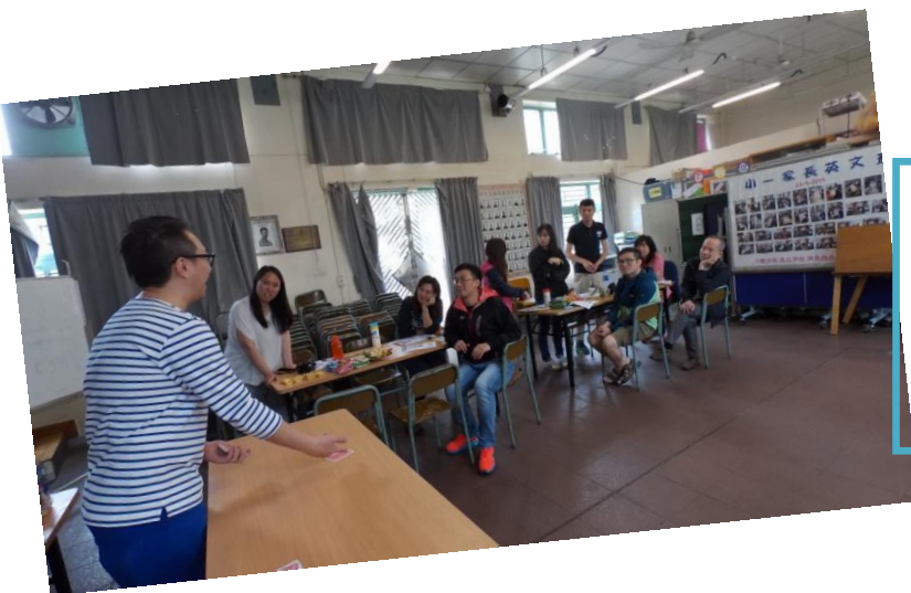
<如果運用「性格強項」建立學 生自信> - 邀請到香港城市大學 應用社會科學系 正向教育研究 小組到校為教師簡介「正向教 育」及「性格強項」的概念