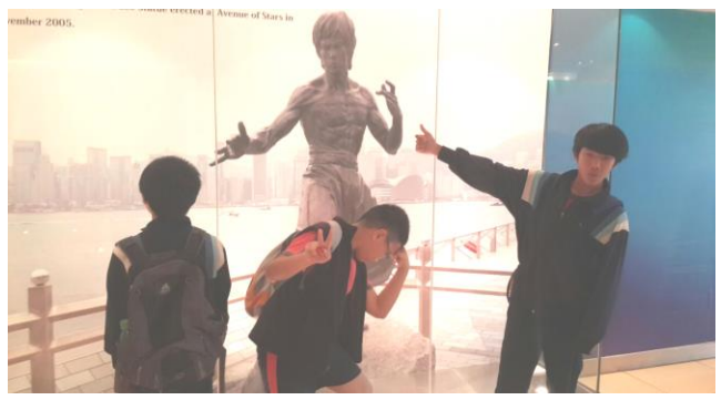
城市定向—中環及香港大學