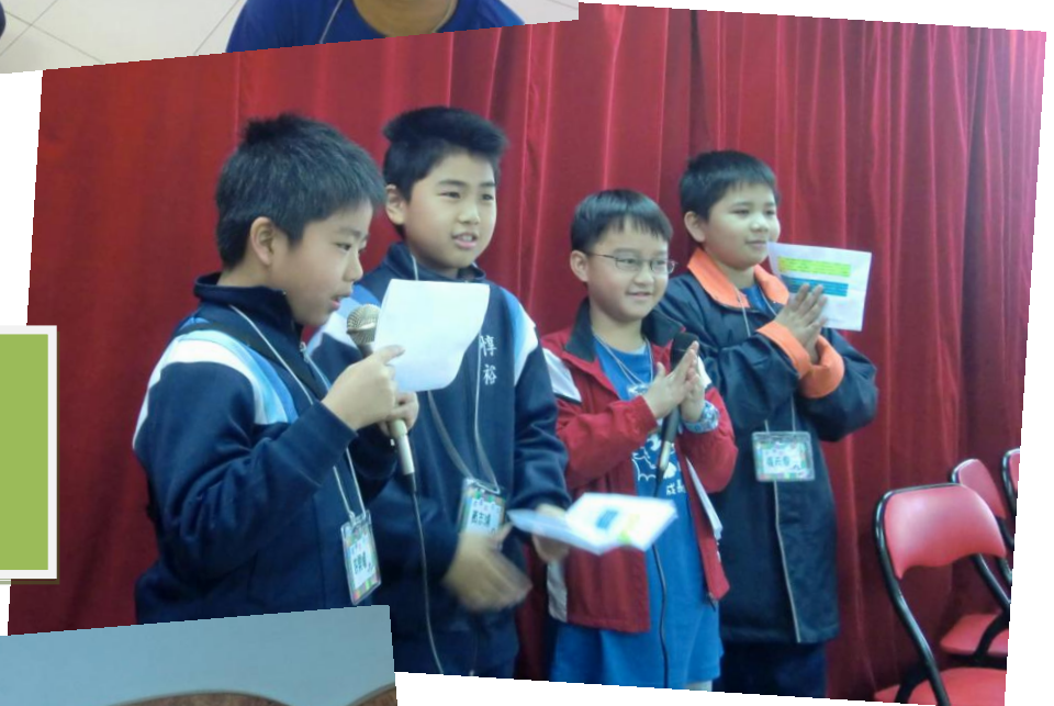
再戰營會- 訓練自理能力