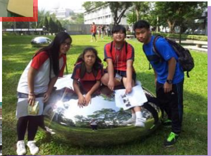
城市定向--鐵路博物館