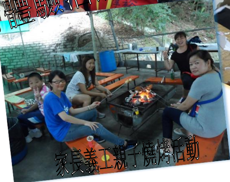
家長義工親子燒烤活動