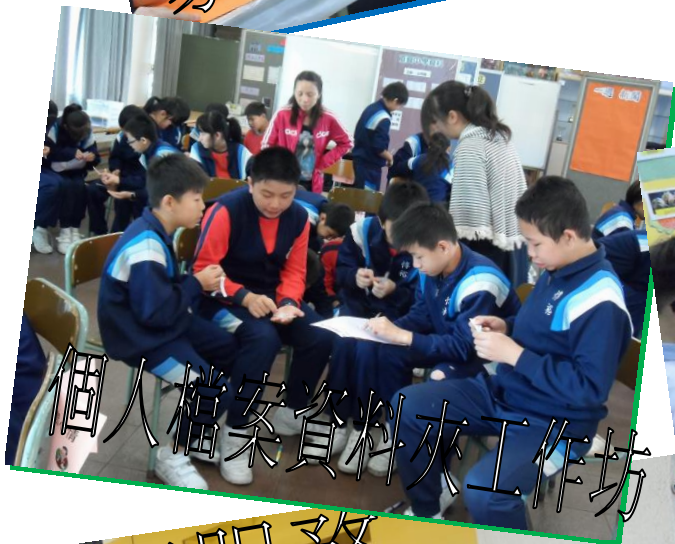
個人檔案資料夾工作坊