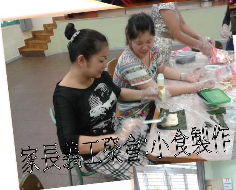
家長義工聚會：小食製作