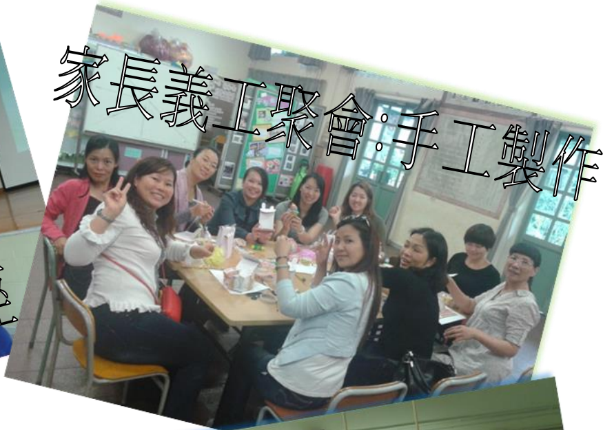
家長義工聚會：手工製作